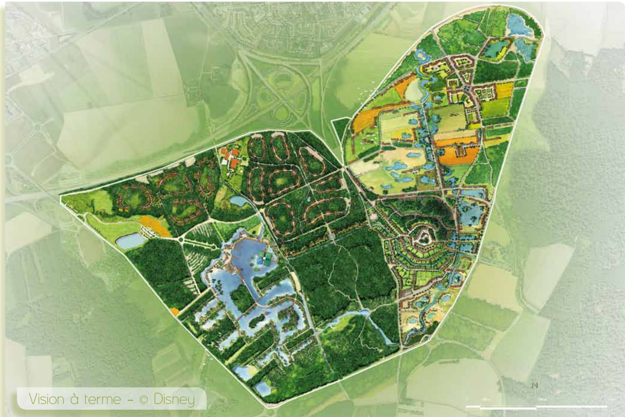
Vision à terme - © Disney